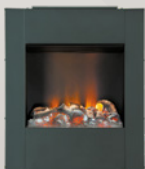
Nissum black S Wall fire engine S 210180 5011139210180