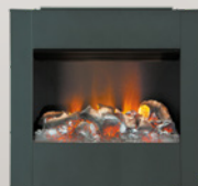
Nissum black L Wall fire engine L 210203 5011139210203