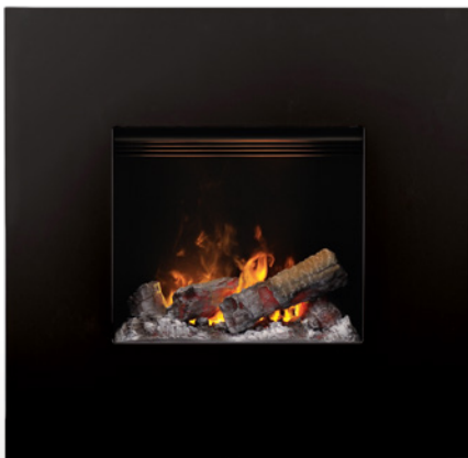
Nissum black S