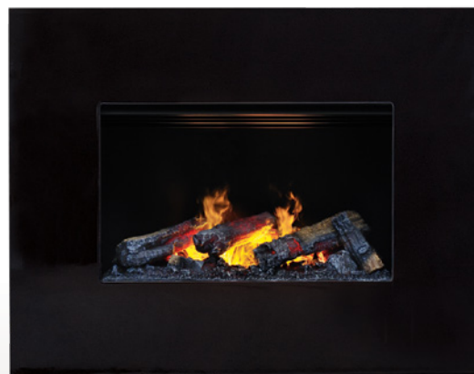
Nissum black L