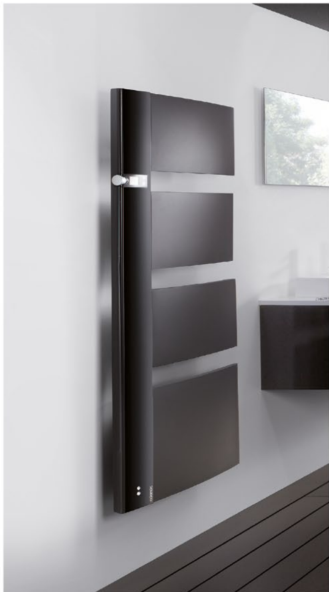
SENSIMUM 1750 W BLACK