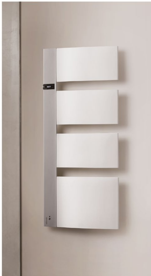
SENSIMUM 1750 W WHITE