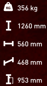
Sola M Indian Night