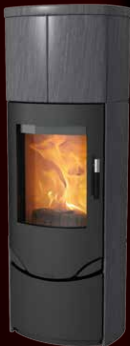
Prio M Indian Night - uden sideglas