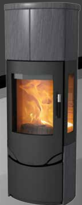
Prio M Indian Night