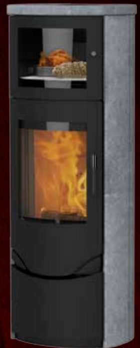
Prio 7M - uden sideglas