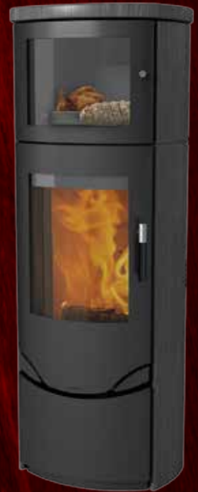
Prio 7M Indian Night - uden sideglas