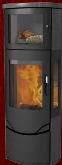
Prio 7M Indian Night