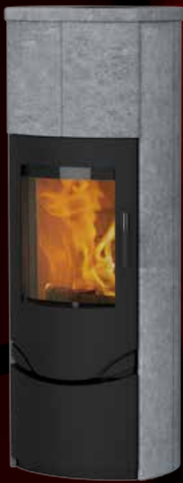
Prio M - uden sideglas