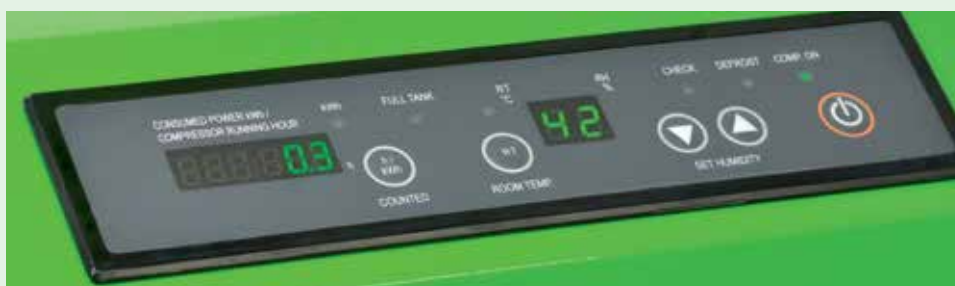
Czytelny panel sterowania