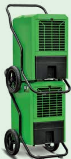
Osuszacze REMKO można ustawiać jeden na drugim