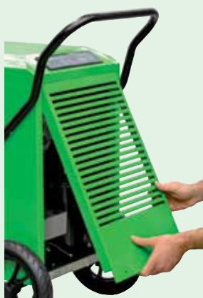
Prosty w obsłudze i konserwacji