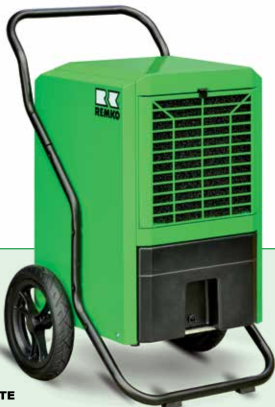
REMKO LTE 60

Niezawodne osuszanie powietrza, wydajniejsze niż słońce i wiatr