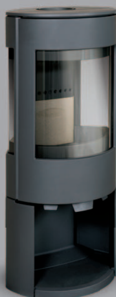
dovre | ASTRO 3 CB/WB