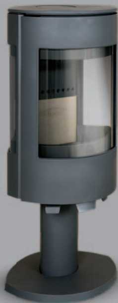
dovre | ASTRO 3 CB/P