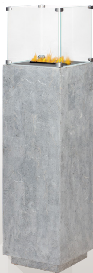
Isola Stone grey SET002 / 8716412211324