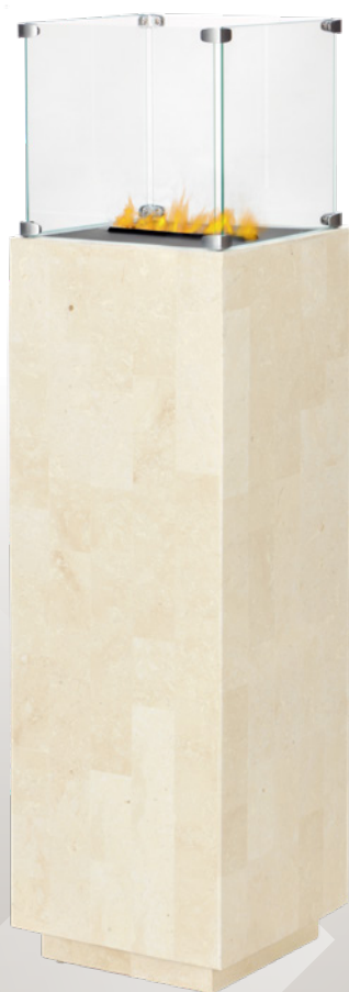
Isola Stone white SET001 / 8716412211317