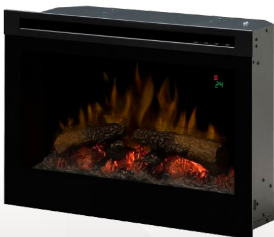
DF2550 – 25" firebox 208323 / 5011139208323

Wkłady do zabudowy 25"/30" posiadają opatentowany, realistyczny efekt płomieni oraz polana do złudzenia przypominające te naturalne. Ogień jaśnieje na tle czarnego lub imitującego cegłę wnętrza, które przywodzi na myśl klasyczne paleniska. Urządzenia wyposażone są we wbudowany moduł grzewczy i termostat elektroniczny. Modele te idealnie nadają się do montażu w niestandardowej zabudowie, wnęce ściennej, a także w nieużywanym kominku gazowym lub opalanym drewnem.