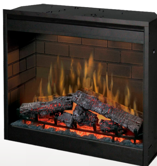
DF3020 – 30" firebox 208286 / 5011139208286